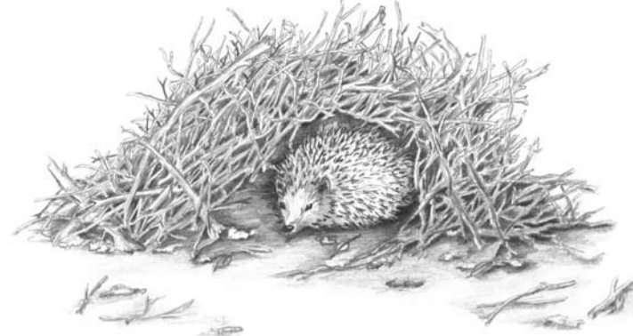
V přírodě si ježci často staví hnízdo pod hromadou větví.

buď použitím gumové láhve naplněné teplou vodou, která se obalí hadříkem a vloží na dno, nebo pomocí vyhřívací destičky či plotýnky (pak je ale lepší použít na ubytování ježčat plastovou bedničku). Vždy je však třeba dbát na to, aby teplota nebyla příliš vysoká a nedošlo k přehřátí mláďat. Bednička či krabice by měla být vystlána měkkými hadříky (ne vatou, ta se ježčatům zachytává na bodlinách a lepí se jim na čumáčky).